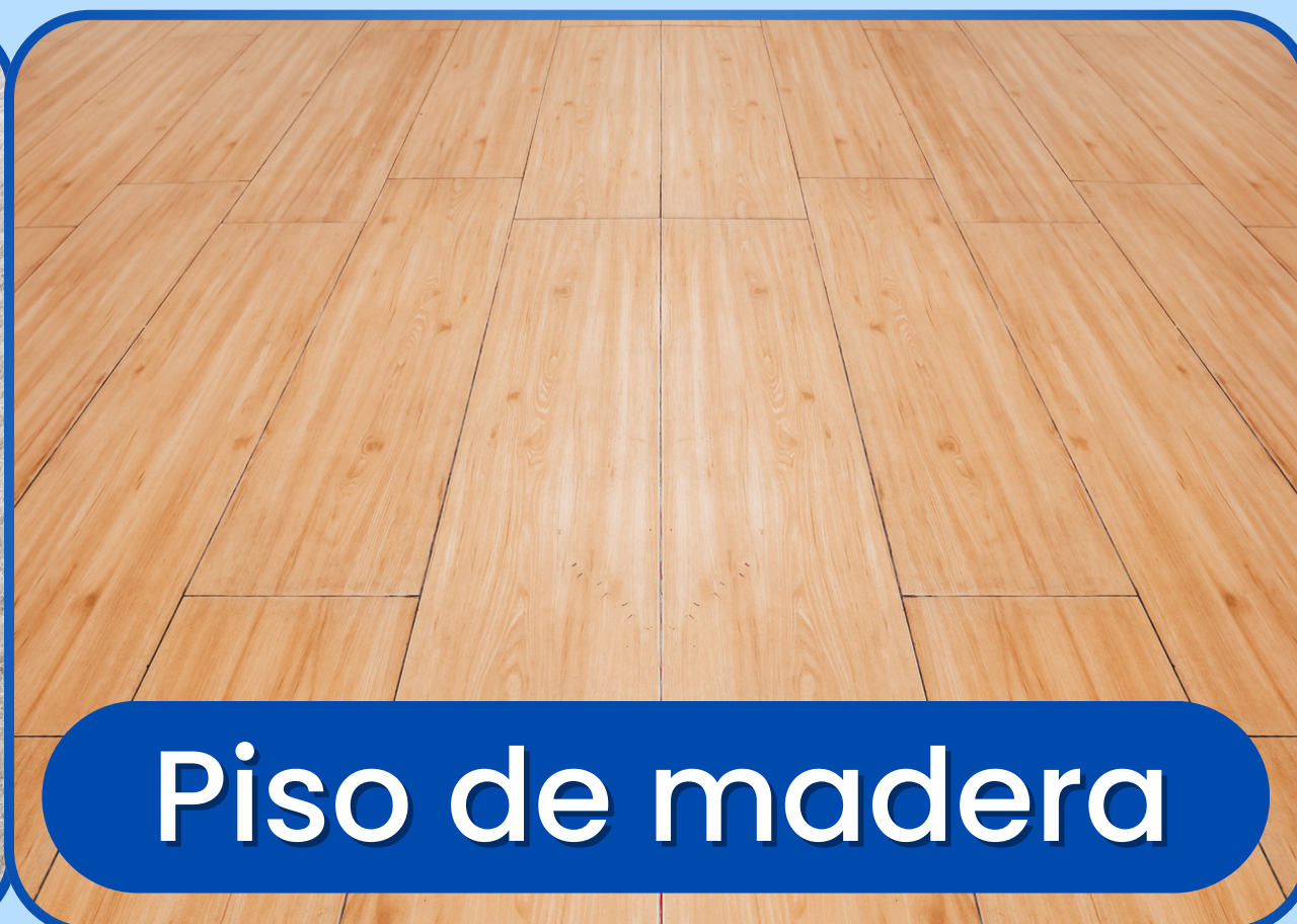
Piso de madera